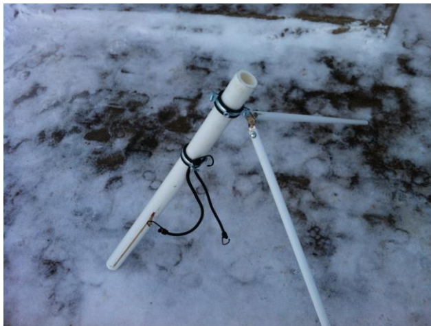
Рис.4. Метательный аппарат «ИС-50»